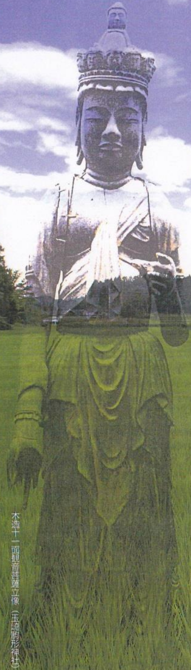
本蓮十一面観音菩薩立像(玉崎彫形社)